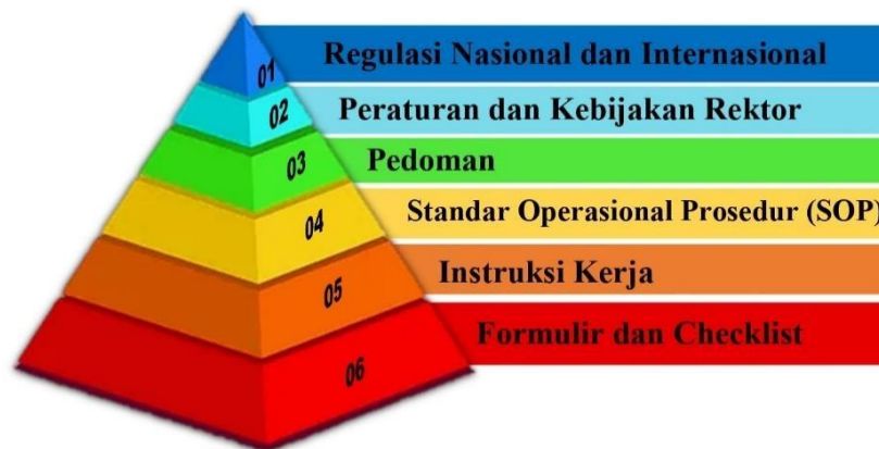
Gambar 1. Hierarki dokumen SMK3 di Universitas Muhammadiyah Palu

Acuan yang digunakan dalam penyusunan dokumen SMK3 di Universitas Muhammadiyah Palu diperoleh melalui sumber internal berupa Ketetapan MWA, Peraturan dan Kebijakan Rektor, maupun sumber eksternal berupa peraturan perundang-undangan, standar nasional dan internasional, serta acuan lain yang relevan.